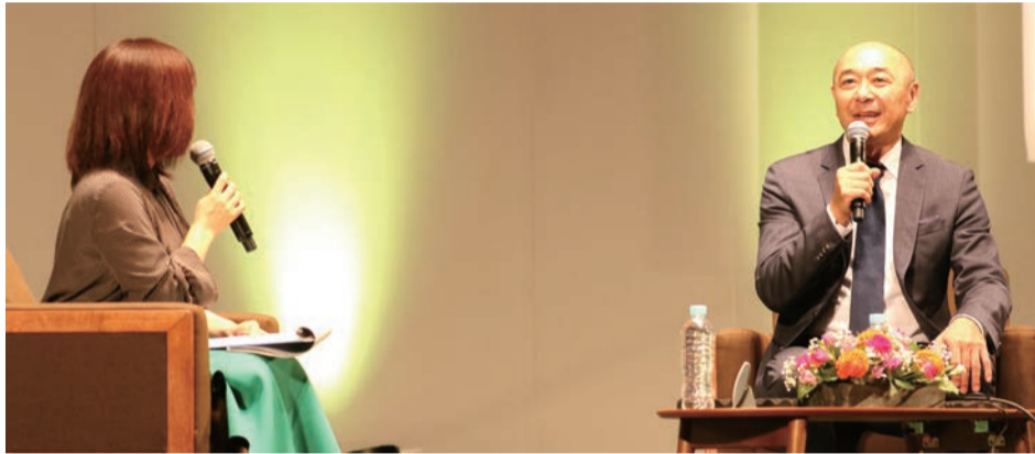
記念講演 俳優・高橋克実氏