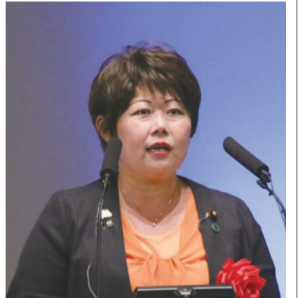
文部科学大臣政務官 宮川典子氏