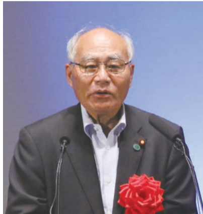
復興大臣 吉野正芳氏