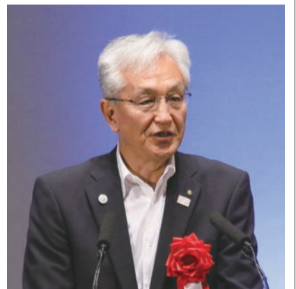
長岡市長 磯田達伸氏