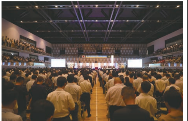
会場に全国のPTA会員約7,500名が集結