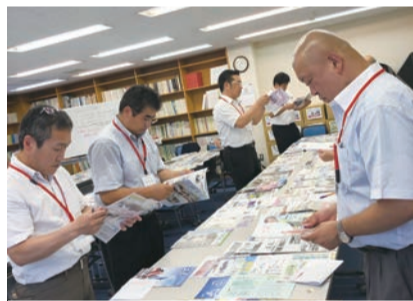
第二次審査の様子

《審査員コメント》 ○ポイント ・審査を行ううえで、ページのボリュームがあるもの、年間発行部数が多いもの、やはり印象に残りやすいグラフだけでなく、座談会や調査分析を行うことで、より良くなるものが多かった。 ○伝え方 ・広報紙を読むと、教職員と保護者の関係がうまくまわっているのが伝わる広報紙がある。そういったものは、学校の様子がよくわかる。広報紙を通じPTA活動がわかり、地域との繋がりが見えるものは特に優れている。