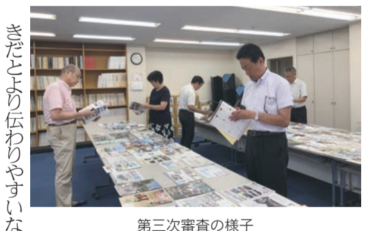
第三次審査の様子

8月9日の最終審査会では、第三次審査での先生方のご意見を参考に、今年度優秀作品を選出した。最終選考に残る作品はどれも甲乙つけがたく、選出には難航を極めた。今年度優秀作品賞を受賞したのは、上記の学校となります。おめでとうございます！ 優秀作品に選ばれたPTAの広報紙は、「優秀広報紙作品集」として発行されます！全国の広報委員の皆さんは、是非受賞ポイントを確認しながら参考にしてみてください。