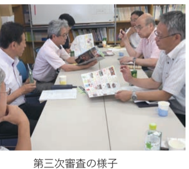
第三次審査の様子

8月6日に開催された広報紙コンクール第三次審査会には、教育関係団体の皆様の全面的なご協力のもと、熱気あふれる審査会が行われました。審査基準を確認したうえで、二次審査を突破した200点もの広報紙一つ一つ、丁寧に目を通し、厳正なる審査が行われました。