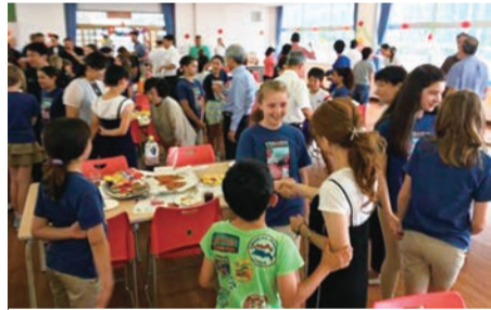
リッチモンド小学校との国際交流

A 2000年度よりPTAが中心となり、アメリカのオレゴン州ポートランド市立リッチモンド小学校の児童を毎年受け入れています。